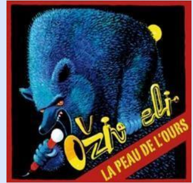
LA PIEL DEL OSO (2010)